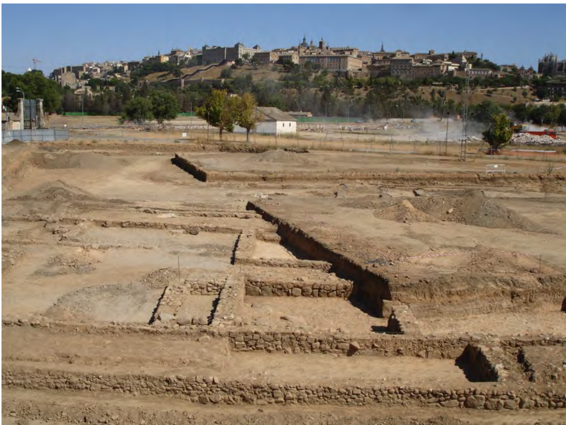
Vista general de uno de los sectores de excavación relacionado con el proyecto de urbanización de Vega Baja en el año 2006 (Parcela R12).