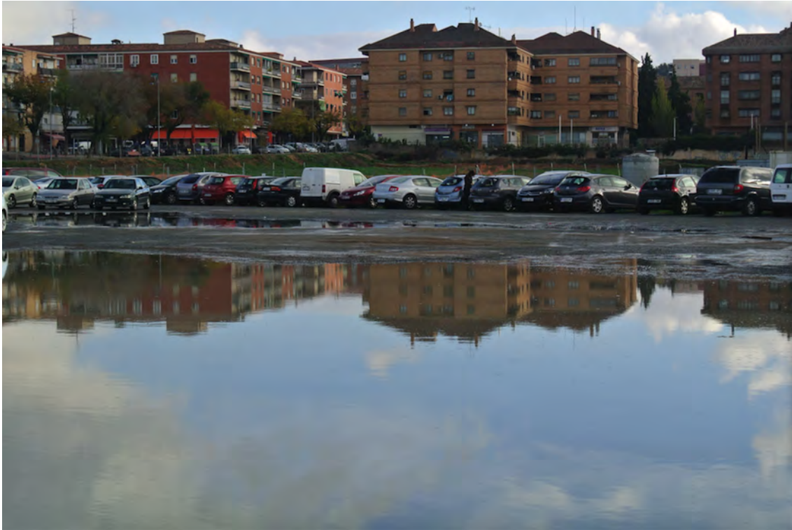
Zona de inundación en temporada de lluvia que afecta tanto a la parcela UA34 como al aparcamiento disuasorio.

ICOMOS COMITÉ NACIONAL ESPAÑOL CONSEJO INTERNACIONAL DE MONUMENTOS Y SITIOS INTERNATIONAL COUNCIL ON MONUMENTS AND SITES CONSEIL INTERNATIONAL DES MONUMENTS ET DES SITES