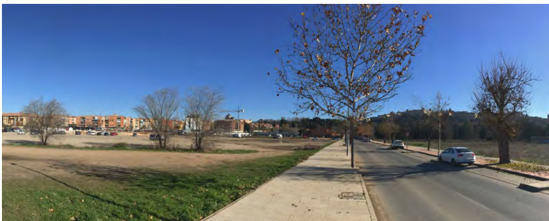
Vista general de Toledo, la ampliación de Santa Teresa y el aparcamiento disuasorio en relación con la avenida de Carlos III (dirección Oeste Este) y superficie de inundación (izquierda de la imagen).

Pese al avanzado estado de la obra, se debe repensar su diseño. La existencia de otros aparcamientos disuasorios en el entorno, da margen para trabajar en un futuro planeamiento de este espacio.