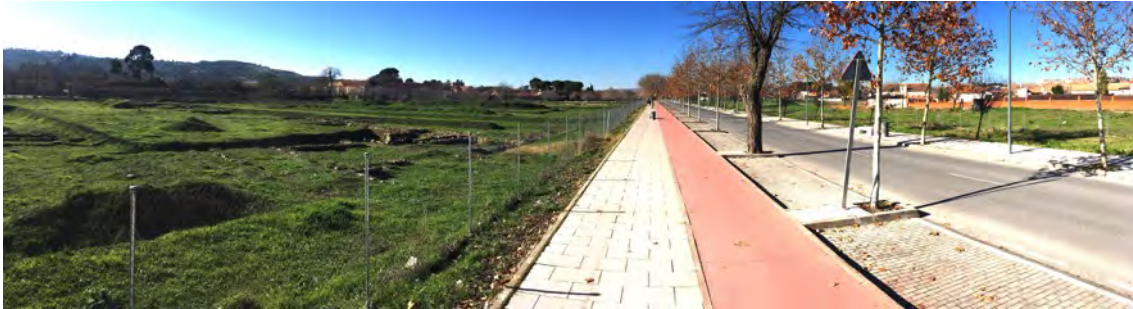
Estado actual de los restos en el sector de la avenida de Carlos III (dirección Este Oeste) que comunica con la Fábrica de Armas y San Pedro El Verde.

El proyecto urbanístico dio paso a una década sin mayores sobresaltos, combinando la resolución de indemnizaciones del proyecto inicial con discretos trabajos de consolidación y limpieza del yacimiento, junto a tímidas propuestas de gestión que nunca llegaron a término.