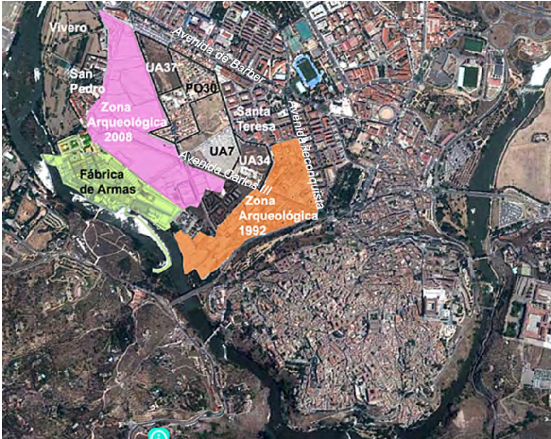
Plano de localización de Vega Baja en el contexto de la ciudad, espacios protegidos y sectores comentados en el texto (Instituto Geográfico Nacional, PNOA modificado).

y así se constata con la presencia de los actuales barrios de Santa Teresa, Avenida de Canónigos y Obrero.