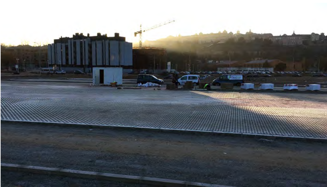
Panorámica general de aparcamiento disuasorio, ampliación de Santa Teresa y CH.

ICOMOS COMITÉ NACIONAL ESPAÑOL CONSEJO INTERNACIONAL DE MONUMENTOS Y SITIOS INTERNATIONAL COUNCIL ON MONUMENTS AND SITES CONSEIL INTERNATIONAL DES MONUMENTS ET DES SITES